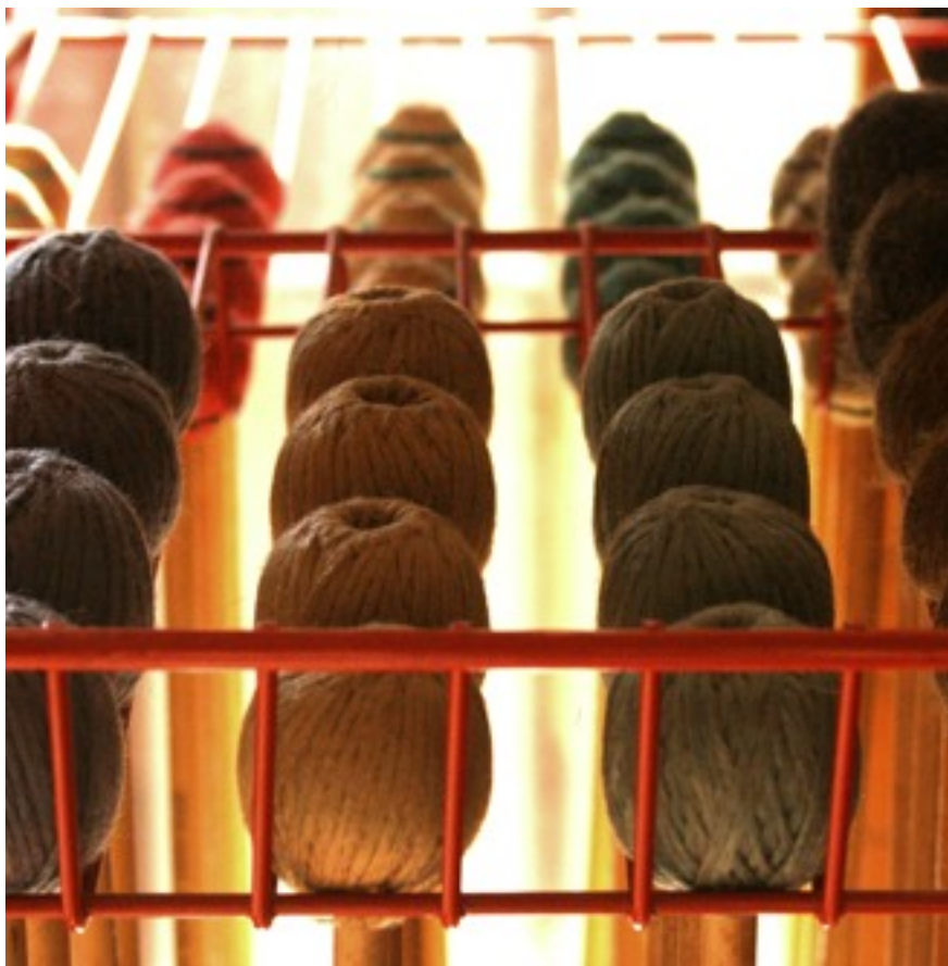
battenti per marimba