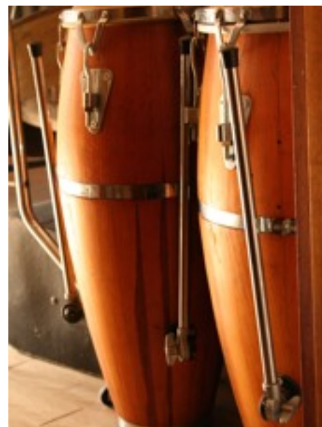
vicino oriente: darbuka in coccio america latina: congas