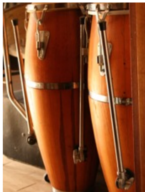
l'attenzione non è mai troppa