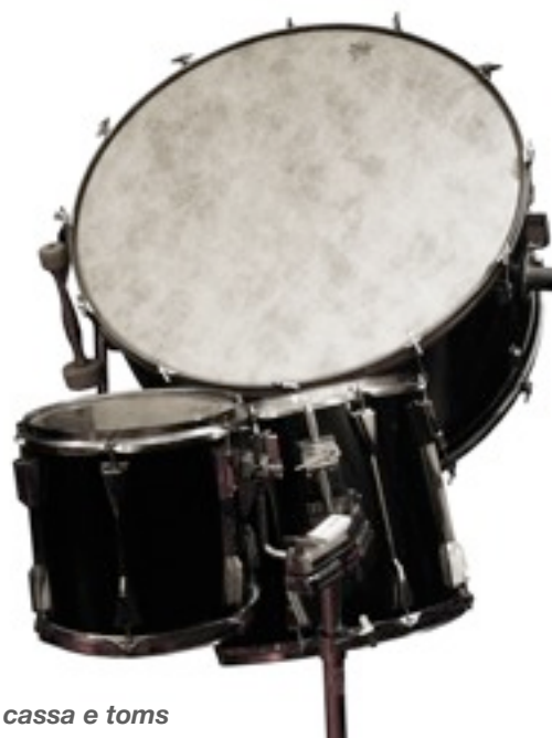
gran cassa e toms

. Lou Harrison (cd allegato con Concerto for Violin with Percussion Orchestra e Fugue for Percussion Quartet )