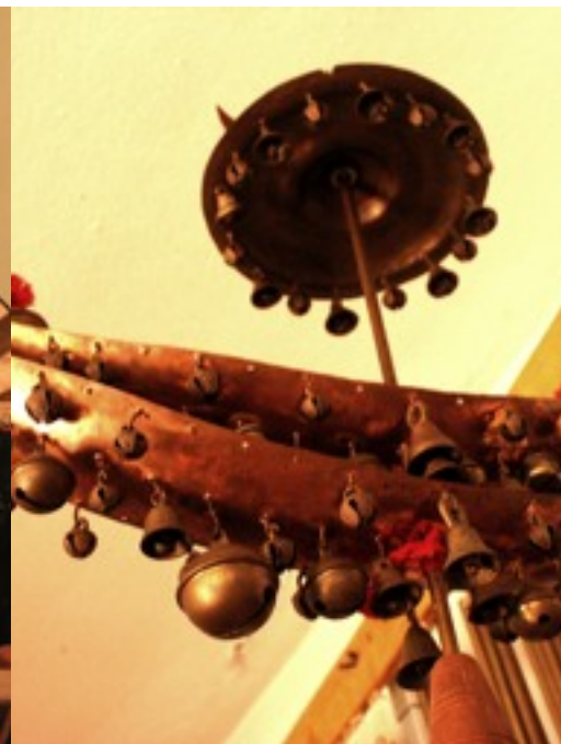
asia: area sino-giapponese