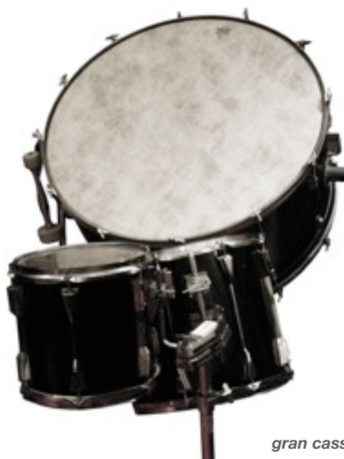
gran cassa e toms

opportunamente selezionate, potranno essere pubblicate per i tipi di Agenda.