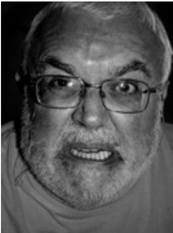
non siamo tranquilli