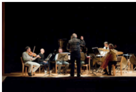
I solisti di San Marino ensemble diretti da Massimiliano Messieri

Il MASKFEST è un festival internazionale che vuole incentivare la cultura musicale contemporanea a livello internazionale, coinvolgendo musicisti di varia provenienza e orientamento stilistico. Il festival è lo strumento necessario per diffondere e valorizzare questo patrimonio artistico e musicale.